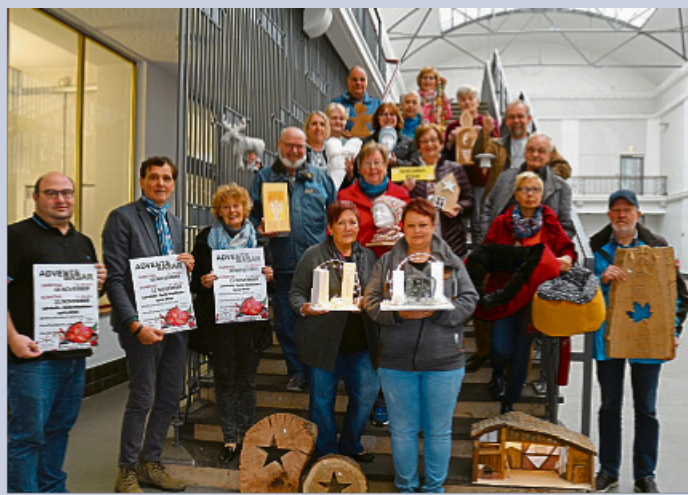
Insgesamt 60 Stände werden beim Adventsbasar in der Lohnhalle aufgebaut.