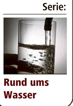
Serie: Rund ums Wasser

Einsatz von Pestiziden im eigenen Garten zu verzichten. Oft gibt es ungiftige Methoden, die man nutzen kann, wie etwa der Einsatz von Brennneseljauche, die gegen Blattläuse wirkt.