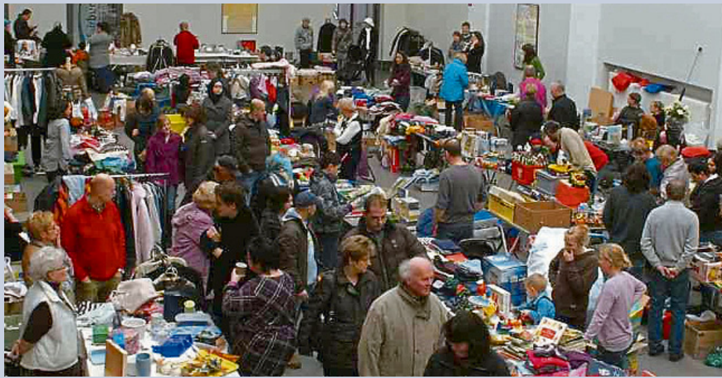
Stöbern und Feilschen: Schnäppchenjäger sind beim Baby- und Kleinkindflohmärkte der Elternschule sowie beim Bürgerflohmärkte willkommen.

Der nächste Termin ist der bewährte Bürgerflohmärkte auf der Zeche Westfalen. Dieser findet am Sonntag, 3. November, in der Zeit von 11